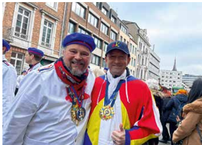
Impressionen vom bunten Treiben des Aachener Karnevals.

Der Karneval und die „tollen Tage“ haben ein utopisches Moment, das darin besteht, dass sie eine Auszeit vom Alltag und seinen Begrenzungen bieten. Während des Karnevals kommen Menschen unterschiedlicher sozialer Schichten, Religionen und Kulturen zusammen und feiern gemeinsam und haben Spaß. Es gibt eine Art kollektives Bewusstsein, das die Grenzen zwischen den Menschen zu verwischen scheint. In dieser Zeit können Menschen ihren Sorgen und Problemen entfliehen und sich frei und unbeschwert fühlen. Sie können in andere Rollen schlüpfen und sich auf neue und kreative Weise ausdrücken. Das gibt ihnen das Gefühl, dass das Leben mehr sein kann als das, was sie normalerweise erleben.