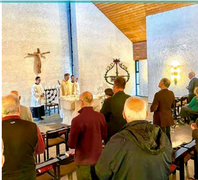
Die täglichen Gottesdienste waren für viele Teilnehmerinnen und Teilnehmer Höhepunkte der BKU-Besinnungstage.

Die 71. BKU-Besinnungstage finden in diesem Jahr vom 2. bis 5. November statt. Ort der Veranstaltung ist erneut Berg Moriah in Simmern, eine Tagungsstätte von Schönstatt/Vallendar. Interessenten können sich per E-Mail bei Michael Scheidgen ( michael.scheidgen@t-online.de ) melden. Bei ihm gibt es auch alle Informationen etwa zum Programm oder der Anreise.