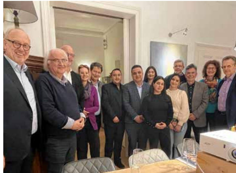
Mit der kritischen Situation der Jesiden beschäftigten sich Mitglieder der DG Bonn gemeinsam mit Experten.