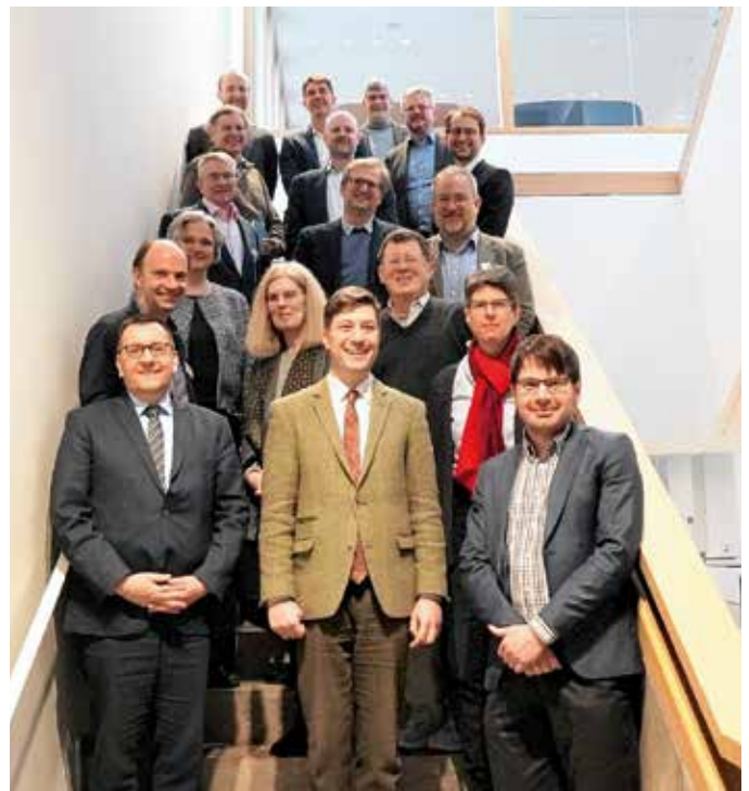
Deutsche und US-amerikanische Theologen sowie Sozialwissenschaftler trafen sich im Katholisch-Sozialen Institut (KSI) in Siegburg, um sich zu christlich-sozialetischen Fragen auszutauschen.

Auch wurde erörtert, was Solidarität mit Blick auf den Sozialstaat sowie im Kontext der durch Migration immer vielfältiger wer-