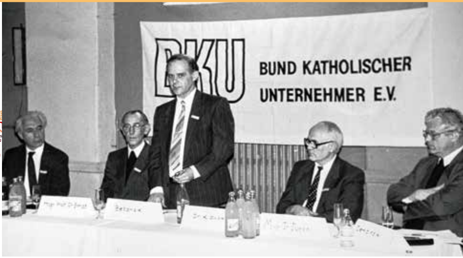
Familienbetriebe prägten die Wirtschaft in Deutschland. Nach dem Fall der Mauer ging es im BKU in den neuen Bundesländern um die Zukunft mit der Sozialen Marktwirtschaft.

Irenik“. Damit griff der weit über sein eigenes Fach hinaus gebildete Ökonom ein Konzept aus der reformatorischen Theologie des späten 16. des 17. Jahrhunderts auf. Die Ireniker, deren Bezeichnung sich ableitet von dem griechischen Begriff eirenē (Frieden), lebten in der Epoche der verheerenden Konfessionskriege in Europa. Ihr Ziel war es, den zerstörerischen Kampf um Dogmen und Glaubenswahrheiten zu überwinden. Den Glaubenskrieg lehnten sie nicht etwa aus einem bloß emotional-affektiven Pazifismus heraus ab, sondern aus reflektierten theologischen Gründen.