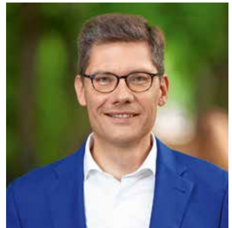
Der Bundestagsabgeordnete Christian Hirte.

Die Soziale Marktwirtschaft hat Zukunft, weil wir sie nach wie vor dringend brauchen. Wir stehen als Gesellschaft vor zum Teil radikalen Veränderungen: Krieg in Europa, Bildung von geopolitischen Blöcken, Klimawandel, massive Umwälzungen durch digitale Technologie, Energieunsicherheit und Inflation. Das stellt Unternehmen und Unternehmer vor einschneidende Veränderungen, und mit ihnen die gewachsenen Strukturen unserer ganzen Wirtschaft.