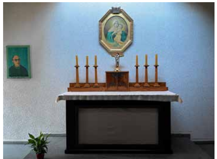
Die Marienverehrung prägt die Schönstatt-Bewegung.