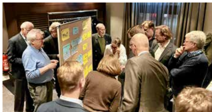
Über die Zukunft der DG Hamburg diskutierten Mitglieder.

Diözesangruppe in der Hansestadt reflektiert kritisch ihre Arbeit.