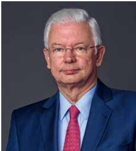
Hessens ehemaliger Ministerpräsident Roland Koch.

Unbestreitbar haben 75 Jahre Soziale Marktwirtschaft materiellen Wohlstand und quasi unbegrenzte Entfaltungsmöglichkeiten für die Bürger gebracht. Zentral ist dabei die Idee von marktwirtschaftlicher Ordnungspolitik: Der Staat gewinnt seine Stärke durch Zurückhaltung und schafft in den Worten Ludwig Erhards einen Rahmen, in dem „die wirtschaftenden Menschen aller sozialen Schichten dessen gewiss sein dürfen, nicht ständig unvorhersehbaren politischen Entscheidungen ausgesetzt zu sein“. Freiheit, Wettbewerb und eigenverantwortliches Handeln stehen oben an.