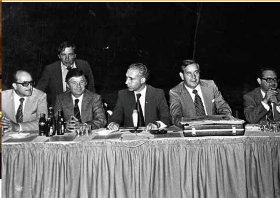
In Gesprächen der BKU-Vertreter mit der Politik ging es auch immer wieder um die Fortentwicklung der Sozialen Marktwirtschaft.

Auf die Bitte von Dietrich Bonhoeffer (1906–1945) hin, verfassten einige Mitglieder aus dem innersten Zirkel des „Freiburger Kreises“ Anfang 1943 eine Denkschrift, die auf einer nach dem Krieg geplanten ökumenischen Weltkirchenkonferenz als programmatische Grundlage für die politische und gesellschaftliche Neuordnung Deutschlands diskutiert werden sollte. Der Anhang zur Wirtschafts- und Sozialordnung wurde dabei im Wesentlichen von Eucken und seinen Universitätskollegen Constantin von Dietze (1891–1973) und Adolf Lampe (1897–1948) verfasst.