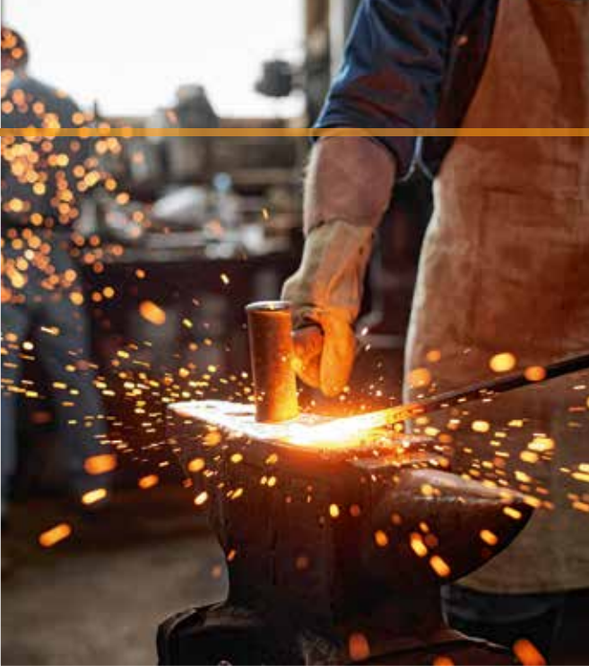
Die Soziale Marktwirtschaft prägte die jungen Jahre der Bundesrepublik.