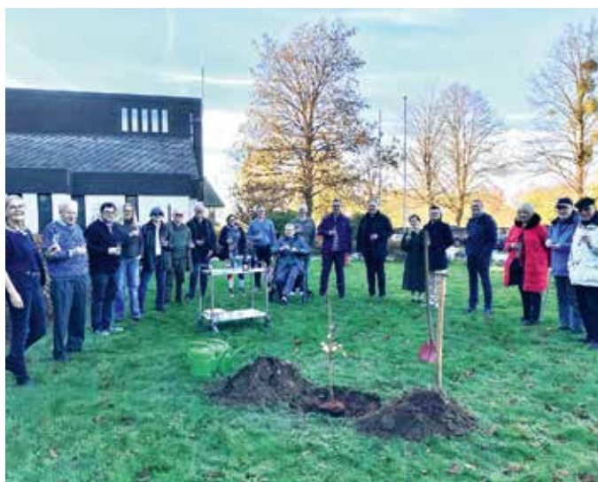
Ein Gruppenbild – zum Abschied – bis zum Wiedersehen im nächsten Jahr.