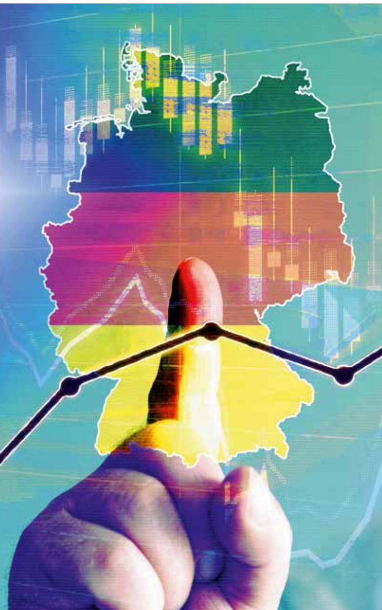
Die Soziale Marktwirtschaft ist und bleibt ein Erfolgsmodell für die deutsche Wirtschaft.

Die Soziale Marktwirtschaft ist und bleibt ein Erfolgsmodell für unsere Wirtschaft. Um sie unter den veränderten Gegebenheiten von Globalisierung und Digitalisierung zu erhalten, muss sich die Politik darauf besinnen, was die deutsche Wirtschaft so erfolgreich gemacht hat.