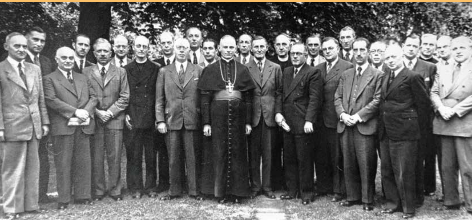
Ein Bild aus der Gründungszeit des BKU: Die katholische Soziallehre und später die Soziale Marktwirtschaft gehörten seit den Gründungsjahren zum Markenkern des BKU.