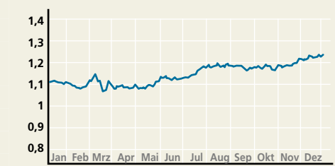
EURO (gegen US-Dollar) seit Jahresbeginn: +0,38% Jahresende: 1,2225 Aktuell: 1,2272 (04.01.2021 / 09:15 Uhr)

setzt worden. Im Streit zwischen den USA und der EU über Subventionen für die Luftfahrtindustrie wollen die USA neue Strafzölle für Produkte aus Deutschland und Frankreich verhängen. Betroffen sind Flugzeugbauteile, Weine und Cognac. Im Handelskonflikt zwischen den USA und China sieht der chinesische Außenminister Wang Yi die Möglichkeit, die Konflikte zwischen beiden Staaten gelöst zu bekommen und eine neue Runde des Dialogs zu beginnen.