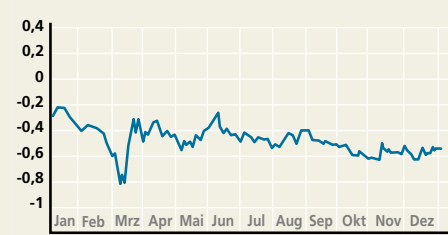
Zinsen (Umlaufrendite) Aktuell: -0,56% (30.12.2020 / Börsenschluss)

auf breiter Front. Der Greenback wird von vielen Investoren unter anderem als sogenannte „Safe Haven“-Währung gesehen und mit der Hoffnung auf flächendeckende Corona-Impfungen in diesem Jahr und dem abebben der Corona-Pandemie steigt wieder der Risikoappetit der Anleger, was auf die Stimmung des US-Dollars drückt. Anders sieht es hingegen mit der jüngsten Entwicklung des Ölpreises aus. Dieser konnte aufgrund des vorsichtigen Vorgehens des Ölverbands Opec plus und der Impfhoffnung profitieren. Die Nordsee-Sorte Brent verteuerte sich am Montag um 1,18 Dollar auf 52,98 Dollar. Das Fass der US-Sorte West Texas Intermediate (WTI) stieg um 1,01 Dollar auf 49,53 Dollar.