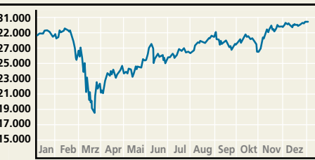
Dow Jones Industrials (DJIA) seit Jahresbeginn: +0,00% Jahresende: 30.606 Aktuell: 30.606 (31.12.2020 / Börsenschluss)