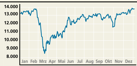
Deutscher Aktienindex (DAX) seit Jahresbeginn: +1,14% Jahresende: 13.718 Aktuell: 13.875 (04.01.2021 / 09:15 Uhr)

Nach monatelangen Verhandlungen haben sich in den USA Demokraten und Republikaner auf ein neues Corona-Paket über 900 Mrd. USD geeinigt. In Sachen Brexit hat das Unter- und Oberhaus des britischen Parlaments dem Brexit-Abkommen zugestimmt und mit der Unterschrift der Queen ist das Abkommen in Kraft ge-