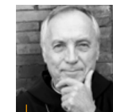
Dr. Notker Wolf