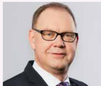
Aart De Geus

Im Anschluss an die Podiumsgespräche laden wir zu einem kleinen Empfang mit der Möglichkeit zur Begegnung ein.